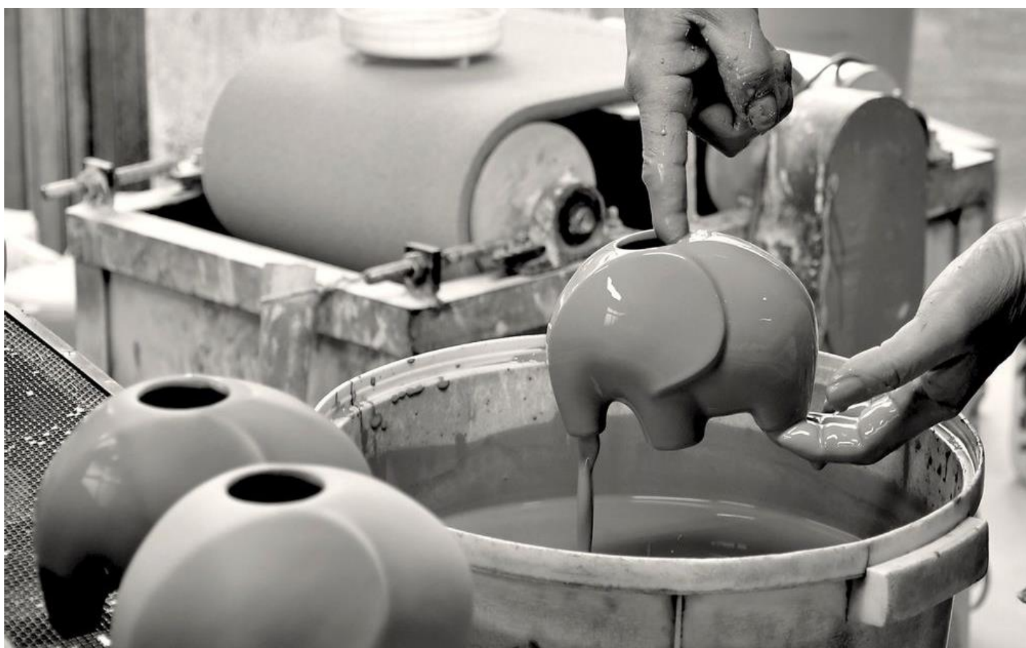
Eleplante, par noted - Eléphant en céramique transformé en jardinière, fabriqué à la main par des artisans de Seto, au Japon.

De jeunes marques ou des maisons séculaires présentes sur le salon s'attachent à transmettre ce patrimoine inestimable. En France, les marques Drugeot , Delavelle ou Sollen inscrivent l'ébénisterie française dans le XXI e siècle avec des collections aux lignes contemporaines, AS'ART sélectionne des pièces de l'Afrique australe, encourageant et favorisant les savoir-faire traditionnels afin de contribuer au développement économique et social des communautés artisanales.