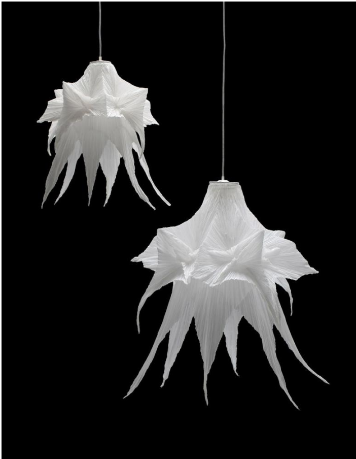
Lampe à poser en papier à caractère organique, aquatique et corallien, collection Aquatiques, par Charlot & Cie