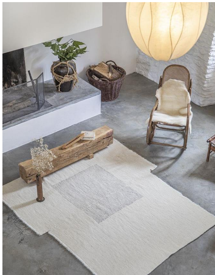
Tapis Semis tissé et cousu main, fabriqué en Ariège (France), par Laines Paysannes

Tisser une passerelle entre les cultures du monde, rendre possible de nouveaux modes de créer et de consommer le design et la décoration d'intérieur, faire perdurer les métiers artisanaux d'exception et les propulser dans l'avenir, faire la lumière sur les nouvelles initiatives porteuses de sens et d'innovation, c'est la promesse engagée du prochain salon Maison&Objet Paris, du 19 au 23 janvier 2023.