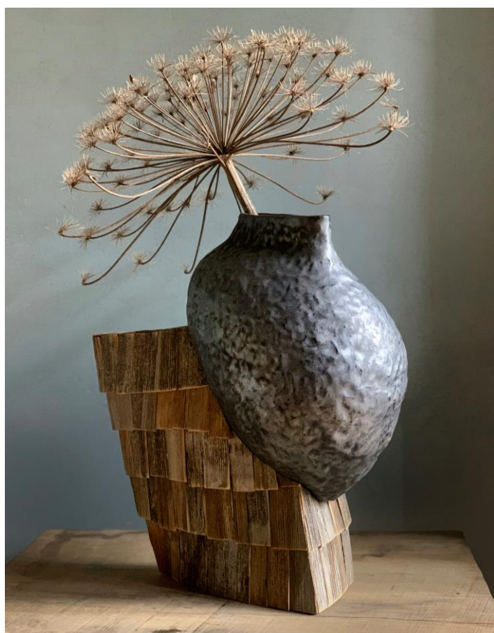
Vase en céramique, collection "Gonta" par le Studio Natura Ceramica / Andriy et Olesya Voznicki – Dans le cadre de l'exposition "L'Art de la Résilience"