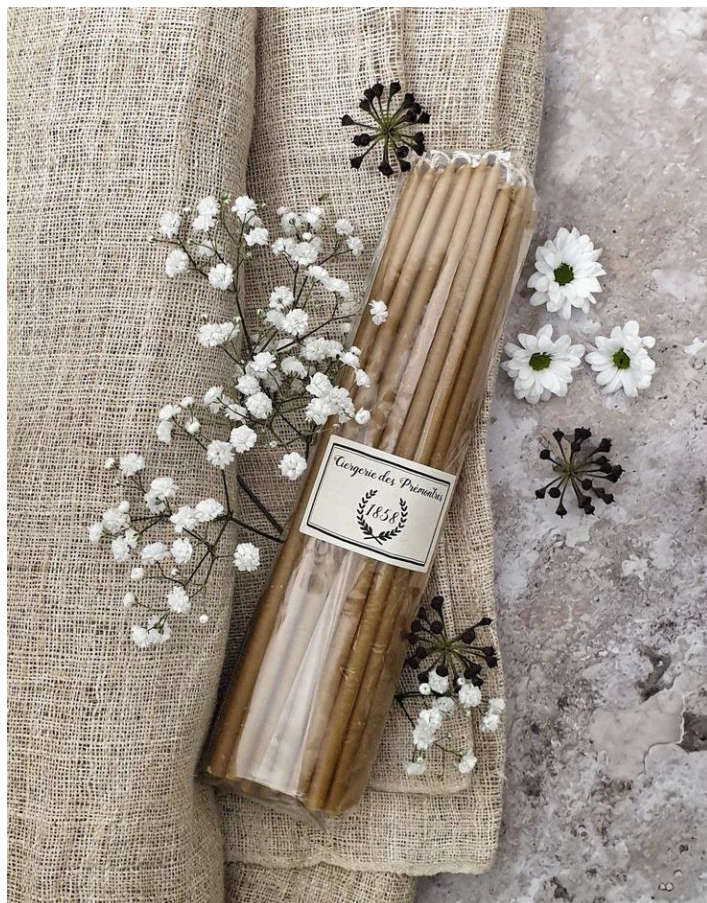
Cierges « à la plongée », procédé du XV siècle, par la Ciergerie de l'Abbaye des Prémontrés

Noma, la maison d'édition française qui ne travaille qu'à partir de matériaux recyclés, la Ciergerie des Prémontrés qui perpétue le savoir-faire ancestral des Pères blancs de l'Abbaye des Prémontrés, Care by me, la marque danoise qui imagine des collections de vêtements et accessoires doux et chauds ou les tapis de la Laines Paysannes en circuit court s'affirment comme autant de stands réjouissants et pleins de sens.