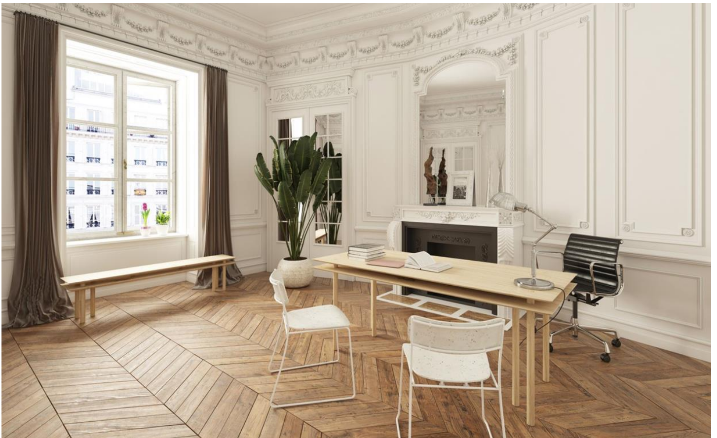
Table et bureau multifonction Nii, par Noma Editions