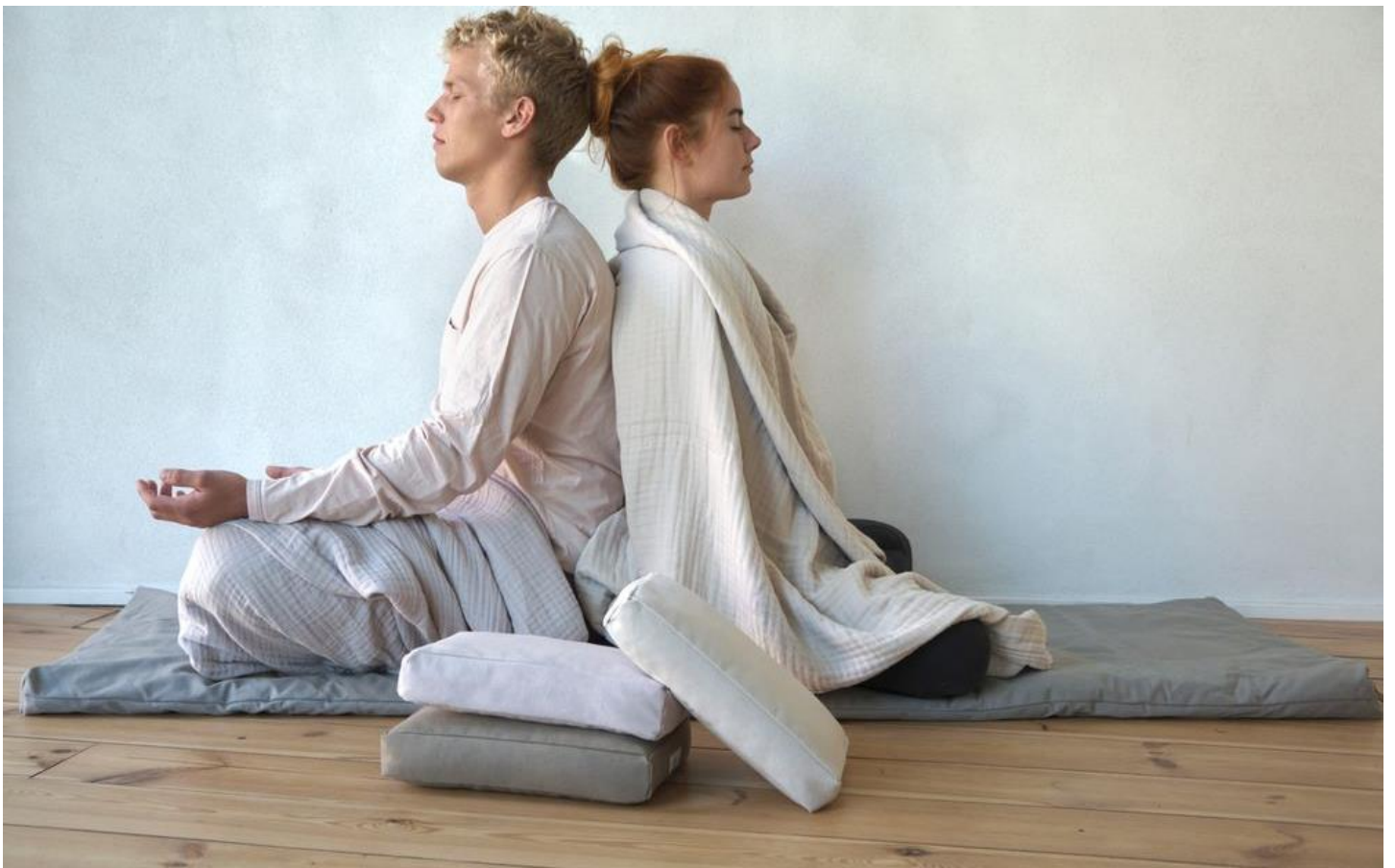
Plaid en coton biologique conçu par la marque danoise The Organic Company, dont l'objectif est de toujours produire des articles design, de qualité et là pour durer, sous la devise « Consommer moins mais mieux »