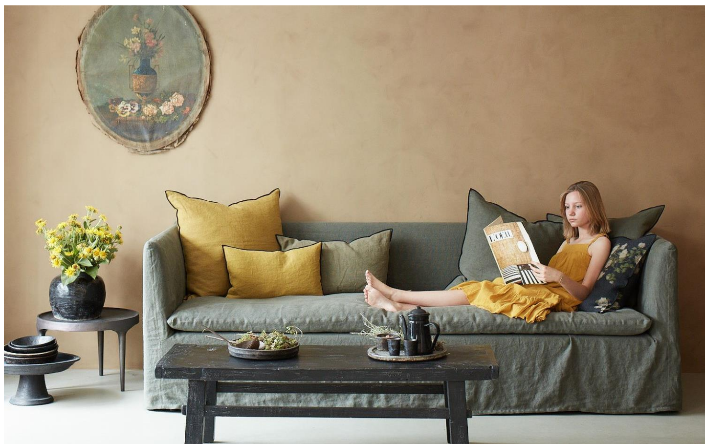
Canapé en lin, collection BOHO, par Maison de Vacances