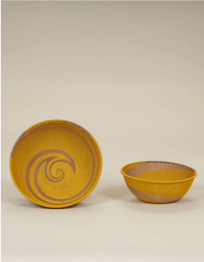
Collection de vanneries en fil de téléphone proposée par AS'ART qui exprime la richesse du travail des Zoulous, mettant à l'honneur les traditions africaines et le savoir-faire artisanal sud-africain