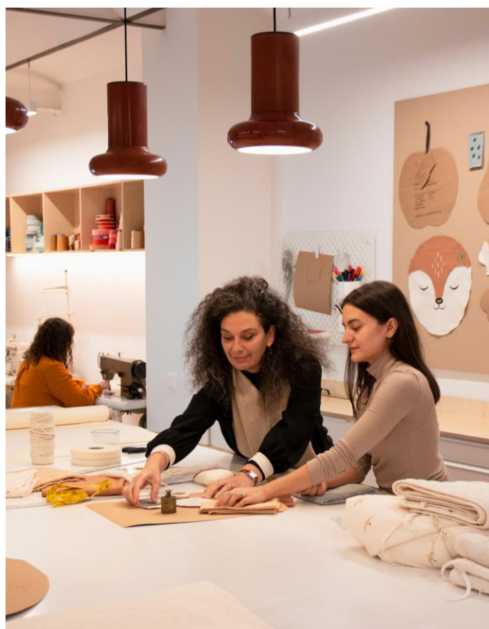
Conception de produits de la marque Nobodinoz, qui imagine et fabrique en France et à Barcelone des produits pour toute la famille et respectueux de l'environnement