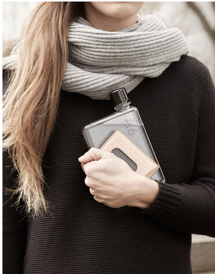
Une solution pratique et responsable pour s'hydrater et réduire ses déchets plastiques, avec la gourde A6 par Memobottle

Ainsi, dans l'espace de repérage des nouveautés « What's New? » de François Bernard, on évoquera le lien aux matériaux bruts et à la nature dans une impulsion baptisée « Grounded », illustration d'une nouvelle facette du luxe, où l'or et les paillettes cèdent le pas à la simplicité.