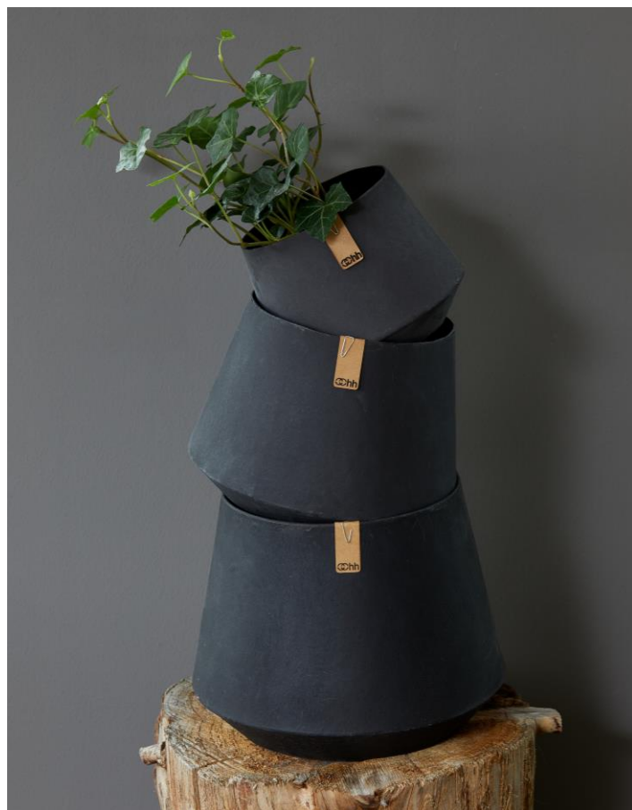
Pots en matériaux recyclés, de la collection OOHH par Lubech Living